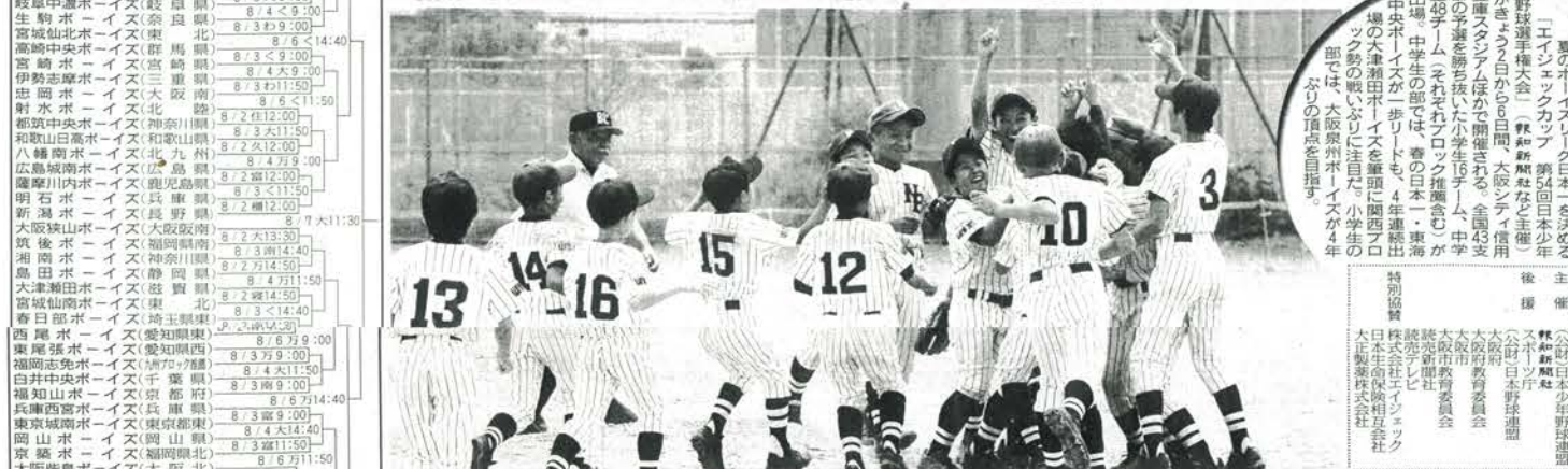
◇エイジエックカップ 第54回日本少年野球選手権大会◇