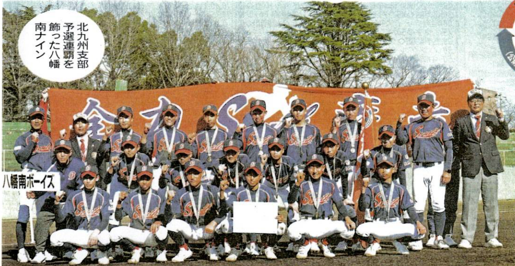
北九州支部予選連覇を飾った八幡南ボーイズ

第19回九州選抜大会予選 の出場権を得た。そのほかの支部は3~6月に順次、予選が開かれる。本戦は7月に沖縄で行われ、九州ブロック全9支部の代表16チームが出場する。 (弓削 大輔)